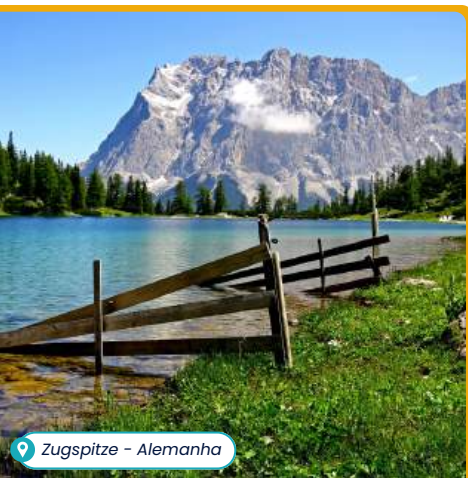
Zugspitze – Alemanha