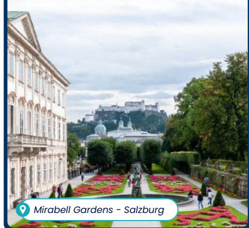
Mirabell Gardens – Salzburg